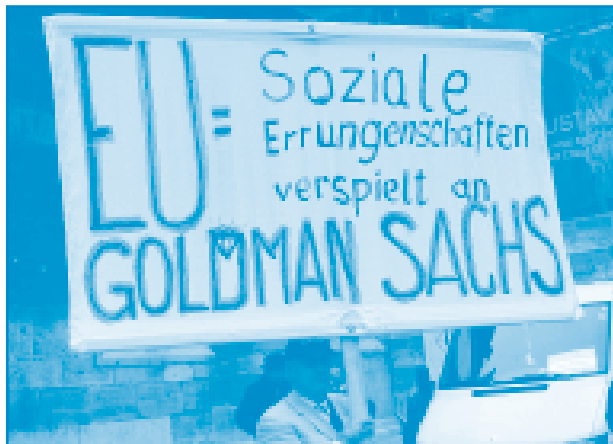
Transparent bei der Anti-EU-Demonstration am Nationalfeiertag des Jahres 2012 in Wien

Im Mai, Juni und Juli (werden) wir zahlreiche AKTIONSTAGE auf den zentralen öffentlichen Plätzen von Landes- und Bezirkshauptstädten in Wien, N.Ö., O.Ö.,